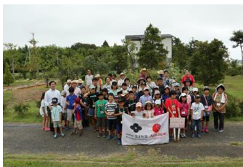
<交流イベント参加者>

難民を助ける会は、震災発生直後から、被災各地で各種緊急支援ならびに復興支援活動を行っています。その中に、高濃度の放射線被害により、屋外活動が制限され、運動不足による健康への悪影響や精神的ストレスにさらされている相馬市など福島県浜通りの幼児・児童並びにその家族を対象に、県内で開催している交流イベントがあります。イベントは参加者の増加とともに規模が拡大し、地元のボランティアや市町村や教育機関とも連携した大きなプロジェクトへと発展しています。