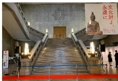
<東京国立博物館 東京>