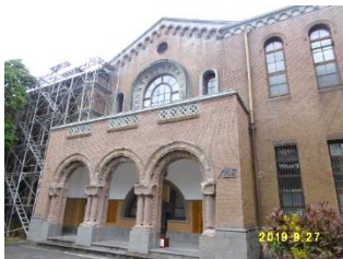
<台湾大学の日本研究センター>

これは半世紀に及ぶ日本統治下（1895年～1945年）で、日本を深く理解していた知識人が現役をリタイヤする一方、政治・経済の分野で中核を占める層に欧米留学組が増えてきたこと、若い世代はアニメやコスプレなど日本のポップカルチャーに関心は高いものの、日本の理解が表層的に留まっていることなどへの危機感の表れでもあります。