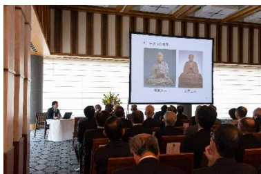
<講演 今津節生奈良大学教授>