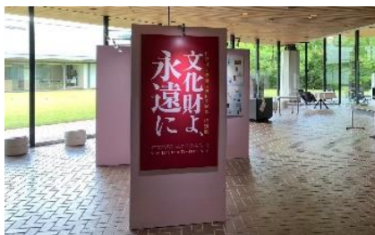
<泉屋博古館本館 京都>