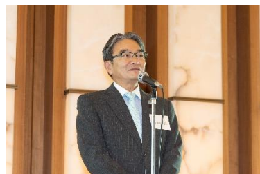
<来賓ご挨拶 宮田亮平文化庁長官>