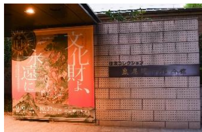
<泉屋博古館分館 東京>