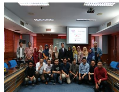
<スラウェシ島のハサヌディン大学>

この他、住友財団では2011年～2012年にかけて、首都ウランバートルから西300kmに位置する「カラコルム博物館」の所蔵文化財に対し、修復助成を行っています。