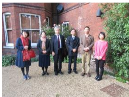
センズベリー日本芸術研究所の建物の前にて研究所の皆様と

1956年に実業家チェスター・ビーティ卿の遺品をもとに設立された図書館。日本の優れた奈良絵本・絵巻を多く所蔵しています。