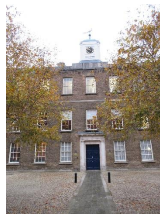
ダブリン城内にあるチェスター・ビーティ図書館

今後、同研究所を通じてイギリスを中心とするヨーロッパの美術館・博物館・大学図書館等の日本美術品の保有状況や修復ニーズの情報を入手できることや様々な人脈の拡大が期待できます。