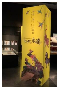
<九州国立博物館 福岡>